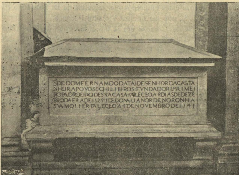
Túmulo dos undadores